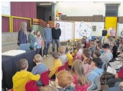
„Die Frage der Farbe ist immer ein Thema.“