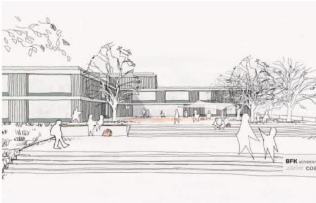
So soll das neue Schulgebäude aussehen.

Die Mutigsten durften nach vorne kommen, um ihre Wünsche zu formulieren. Bei den Jüngsten standen vor allem Verbesserungen zur Pausengestaltung auf der Liste. Klettergerüst, Schaukel und Rutschbahn.